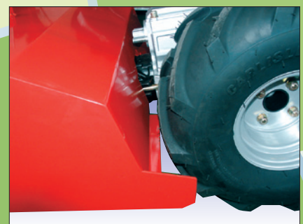
Der nahe Anbau am Einachser bedingt kein unhandliches Gegengewicht

l'espace entre le rouleau grillagé et la plaque de nivellement permet d'éviter tous les blocages d'objets