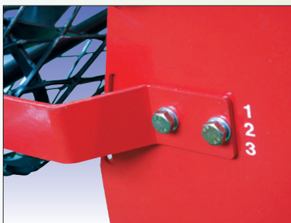
Feineinstellung von Planierwalze

kurz, wendig und im Gleichgewicht courte, agile et stable